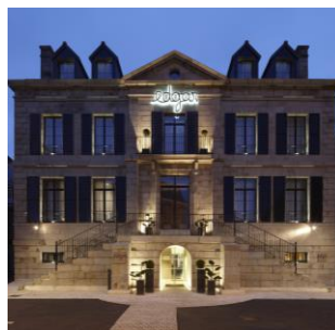
Singuliers Hôtels Edgar à St-Brieuc (22)

Élégante et atypique, la collection Singuliers Hôtels met en avant 4 écrans d'exception. Véritable artisan d'émotions, chaque hôtelier exprime sa singularité à travers une qualité de service irréprochable et un fort engagement durable.