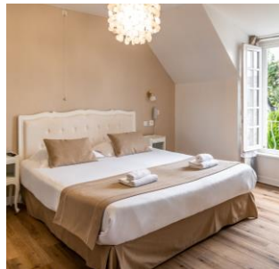
Demeures & Châteaux Hôtel de la Porte de Saint Malo à Dinan (22)