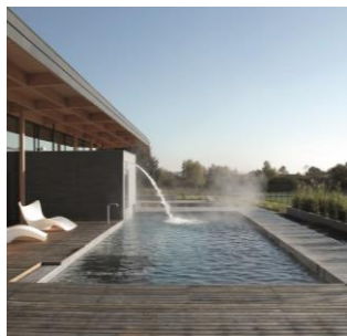
Singuliers Hôtels Julien à Fouday (67)