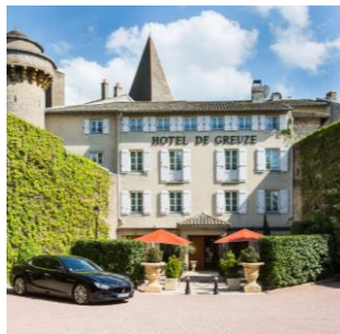
Demeures & Châteaux Hôtel de Greuze à Tournus (71)

Avec Demeures & Châteaux, de nouvelles portes s'ouvrent sur des chapitres uniques du patrimoine français. Voici 5 lieux majestueux chargés d'histoire où vivre la vie de château :