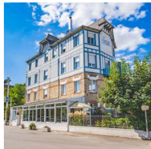
Demeures & Châteaux Hôtel le Saint Pierre à La Baule (44)