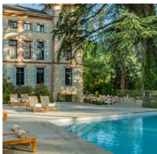
Singuliers Hôtels Le Château de Fiac (81)