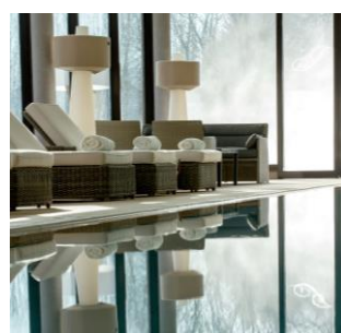
Singuliers Hôtels La Source des Sens à Morsbronn-les-Bains (67)