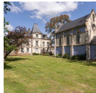
Demeures & Châteaux Château de la Richerie à Beaurepaire (85)