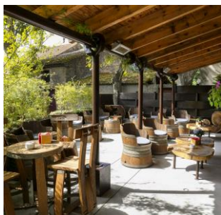
Singuliers Hôtels L'Auberge du Vieux Puits à Fontjoncouse (11)